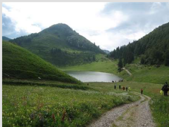
Ka Šiškom jezeru