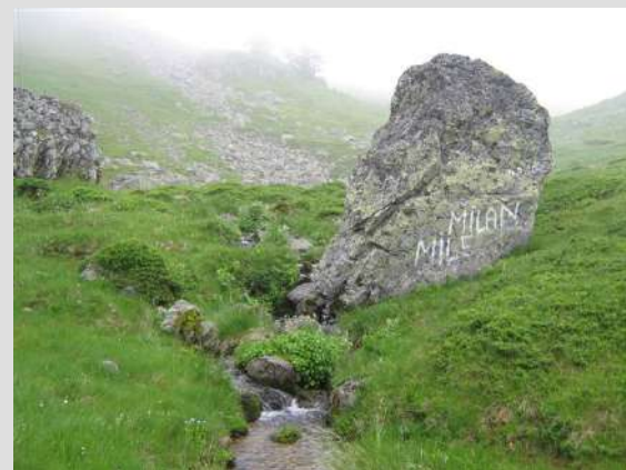
Izvor Biogradske reke

U jednom trenutku, čini nam se da se magla podiže...radujemo se. U stvari, malo se spuštamo, pa je zbog toga magle manje. Odjednom, vidimo nešto...Vidimo zelene padine Bjelasice, žuto cveće rasuto po njima, nepregledne žbunove borovnica koje još nisu sazrele, vidimo njeno ogromno prostranstvo i lepotu. Naziremo je i naslućujemo i pored magle koja se ne predaje, ali polako posustaje i pored sivih oblaka koji su još uvek iznad nas...Prolazimo i pored kamene reke...pegavog, zelenkastog kamenja koje toliko podseća na stene Karpata i koje se survalo niz strmu padinu. A onda, kao da ga je neki čarobni štapić jednim zamahom zaustavio. Ostalo je tu, zarobljeno, nepokretno, dok vreme neumitno protiče pored njega...Svlačimo kabanice...Stižemo do izvora Biogradske reke. Ima ih nekoliko. Sama rečica pravi potočiće i meandre po celoj dolini kroz koju protiče. Sa žbunovima najraznovrsnijeg cveća u njima.