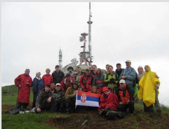
Grupa na Zekovoj glavi